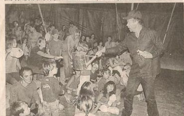
Avec ImproMario, des pros de l'impro, c'est le public qui dicte les thèmes, piochés dans l'arrosage.